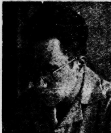
AMIR mau rebut korsi?

gai program untuk masa lama (long term).