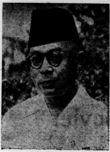
HATTA, satu2nja yang bisa mengatasi pertentangan

PNI/MASJUMI : Buat nanti FDR : Buat sekarang